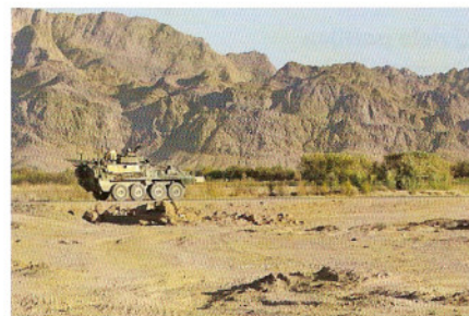
11 mei 2007. Nabij Kandahar Stad, Kandahar. Een Canadees convooy verlaat de militaire basis

De Taliban kan alleen serieuze tegenstand bieden als het beschikt over een brede rekruteringsbasis onder Afghanen en over de aanhoudende steun van een gedeelte van de plaatselijke bevolking. Dit is de kern