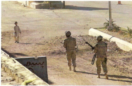
11 april 2007. Arghandab District, Kandahar. Canadese militairen patrouilleren de straten in Arghandab.

van de Nederlandse missie was vervaagd. 2 Maar de hieraan gerelateerde, voor defensie noodzakelijke accentverlegging van opbouw- naar vechtmisatie heeft het debat over de rol van militairen bij ontwikkelingshulp niet verstomd. Terwijl defensie zelf eigenlijk geen onderscheid maakt tussen opbouw- en vechtmisatie, worden deze begrippen binnen het maatschappelijke debat als handvatten gebruikt om de discussie over de rol van militairen in buitenlandse operaties te sturen. 3 Ter illustratie volgen hier twee, vorig jaar verschenen opvattingen. Ontwikkelingswerker Freek Prins schreef in Trouw : "[o]ntwikkelingswerk is een vak. Een machtig boeiend, maar tegelijk ontzettend moeilijk beroep. Dat moet je niet overlaten aan, laten we aannemen, goedwillende soldaten. Die kunnen dat niet." 4 Vanuit het andere 'kamp' schreef onderzoeker en publicist Bart Klem in het blad Internationale Samenwerking : "De grote vraag is (...) niet of, maar hoe militairen zich met wederopbouwprocessen moeten bemoeien." 5 De tweede opvatting is wat genuanceerder en verlegt de discussie naar een zinvoller kader. Als militairen noodgedwongen betrokken moeten zijn bij humanitaire- of ontwikkelingshulp, hoe moeten zij deze rol dan invullen? Dat we deze discussie anno 2008 voeren, is al een kleine stap voorwaarts, aangezien het betekent dat we eindelijk het verstikkende 'veiligheid eerst, dan pas ontwikkeling' adagium achter ons hebben gelaten.