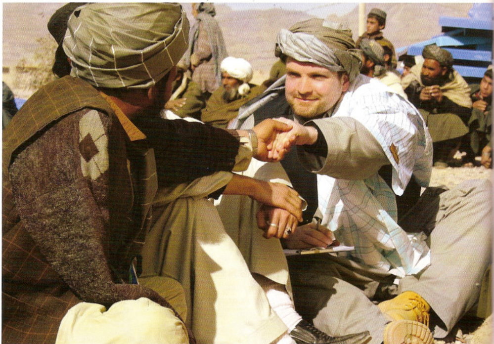
21 januari 2007. De auteur op onderzoek in Zahri Dasht Kamp, Kandahar.

nisaties te berde brengen. Militairen moeten in het algemeen niet op de stoel gaan zitten van de hulpverleners en vice versa. Behalve dat beide beroepsgroepen hun eigen, gespecialiseerde en professionele kennis hebben, is dit vooral van belang voor de veiligheid van de hulpverleners en de plaatselijke bevolking. Ook dat zijn platgetreden paden. Toch blijft overeind dat de huidige 'conflicten en postconflictsituaties' van de 21e eeuw steeds vaker om een zogenaamde 'geïntegreerde benadering' vragen. 6 Dit moet de komende tijd het debat in een constructieve richting sturen. Soldaten weten inmiddels dat zij zowel opbouwen (waar mogelijk) als vechten (waar noodzakelijk). Daarentegen moeten veel ontwikkelingswerkers nog gaan beseffen dat zij vaak noodgedwongen (waar noodzakelijk) onderdeel uitmaken van het veiligheidsinstrumentarium en dat zij (waar mogelijk) een essentiële, directe of indirecte bijdrage kunnen leveren aan het werk van