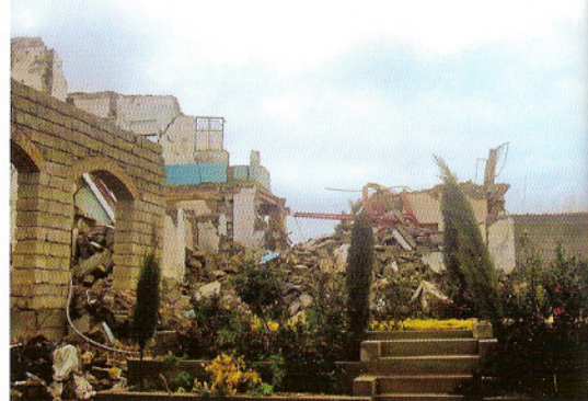
14 januari 2008. Sangin District Helmand. Huizen vernietigd door NAVO bombardementen.

De Uruzgan missie zal de komende twee jaar op pragmatische wijze een koers moeten varen tussen de traditionele, ideologische meningsverschillen en opvattingen door. Daarnaast zal er voor de langere termijn in de interdepartementale projectgroep 'Toekomstverkenningen voor Defensie' in een breder kader goed nagedacht moeten worden over de toekomstige invulling van de geïntegreerde benadering. 11 Die toekomstvisie zal hopelijk nauw aansluiten bij de resultaten van het lopende Senlis Council project omtrent een nieuwe, mondiale veiligheidsarchitectuur (2008-2011). In dit, door een groep internationale, filantropische instellingen en stichtingen gesteund project zal door middel van 'veiligheidslaboratoria' en praktijkgerichte (proef) projecten gekeken worden naar innovatieve benaderingen en moderne veiligheidsinstrumenten om de conflictsituaties van de 21e eeuw het hoofd te bieden. Het nieuwe van deze benadering is niet alleen de praktijkge-