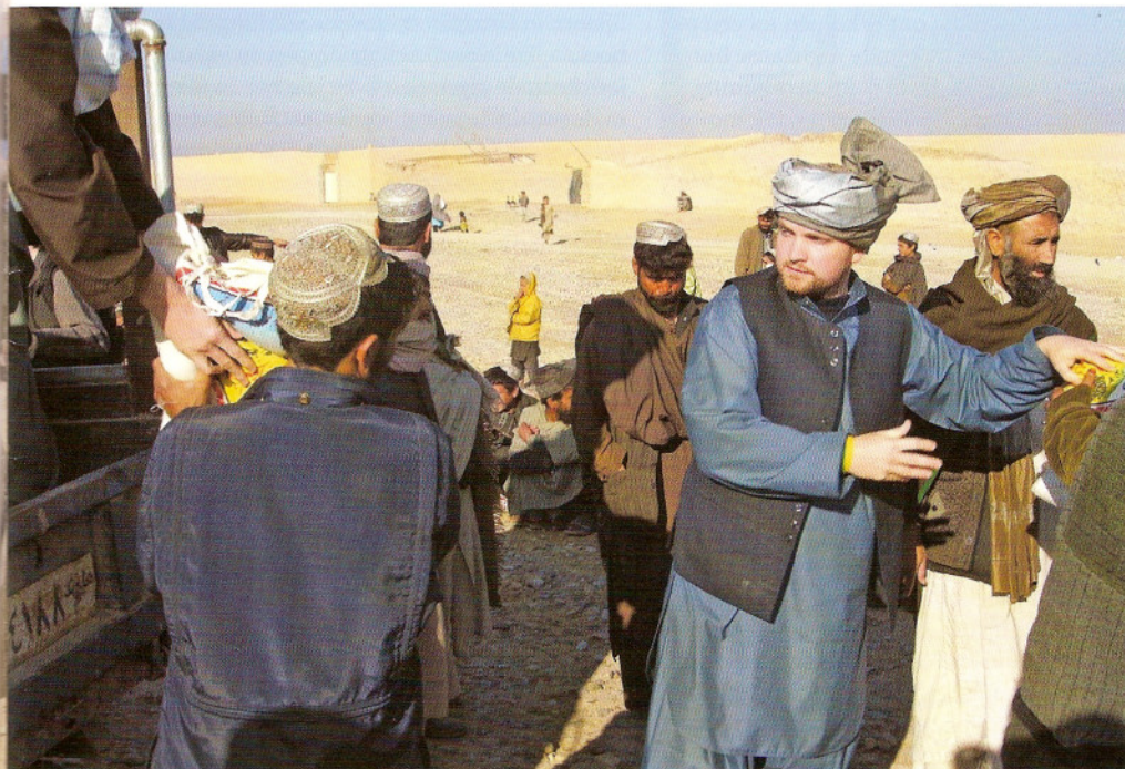
27 januari 2007. Boulan Woestijn Kamp, Kandahar. De auteur helpt bij voedselhulp

noch de zekerheid biedt van een beslissend keerpunt. De werkelijkheid heeft het falen van een voornamelijk militaire benadering duidelijk aangetoond. De Taliban is sterker dan ooit tevoren en de ISAF troepen moeten keer op keer met luchtsteun aan de slag in dezelfde gebieden die eerder meerdere malen heroverd werden: Kajaki, Musa Qala en Sangin in de provincie Helmand; Panjwai en Arghandab in Kandahar en Chora in Uruzgan. Dit zijn inmiddels bekende namen vanwege de toegenomen aandacht in de nationale en internationale media. Waar gaat het dan steeds mis, als onze soldaten onder extreem moeilijke omstan-